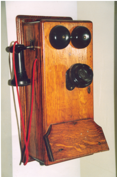
Teléfono de Magneto, finales siglo XIX.

dio hasta en 1886, cuando el gobierno puso a funcionar una pequeña red de 12 teléfonos para el uso oficial.